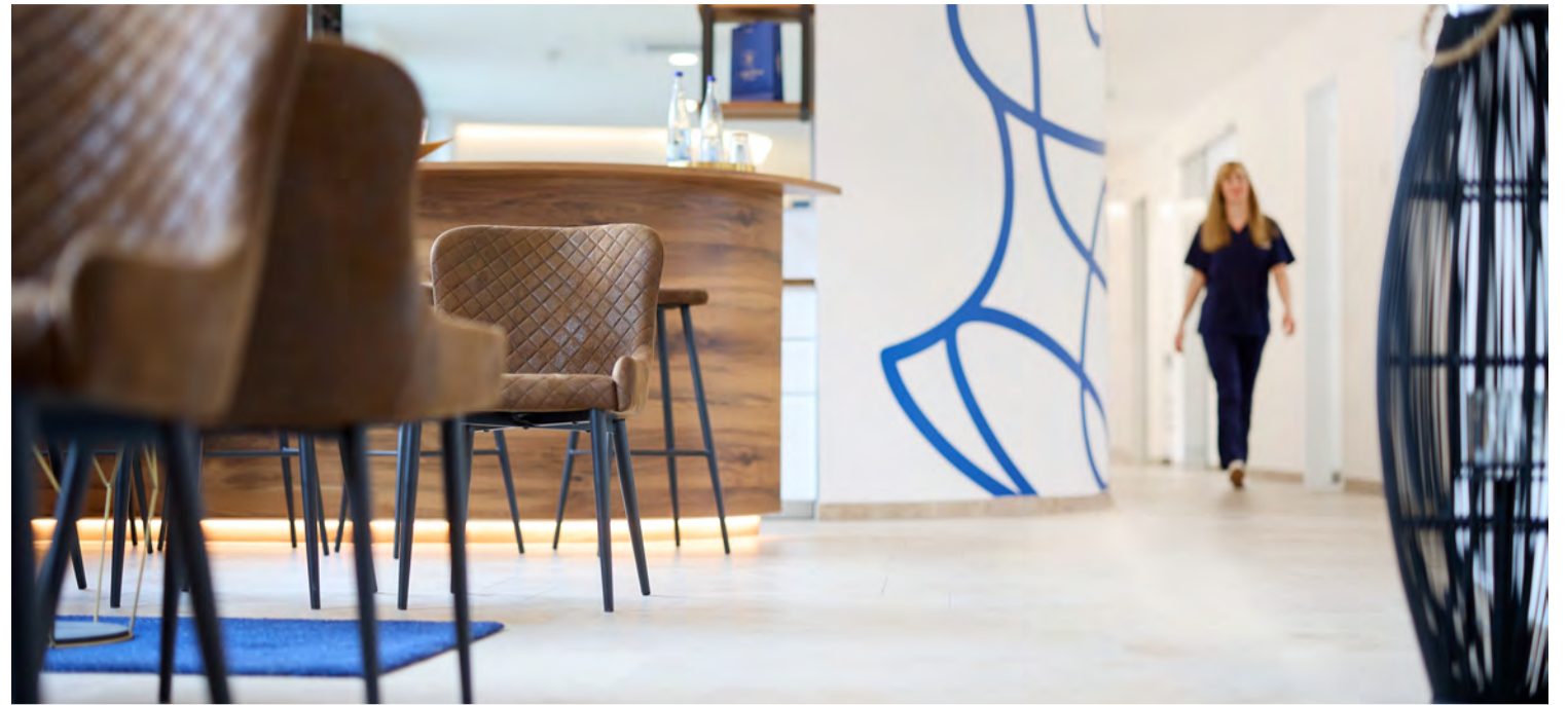
In den lichtdurchfluteten Räumlichkeiten der Enzian Clinic in Metzingen steht die Wohlfühlatmosphäre im Vordergrund.

Bei dieser modernen Technik werden die Haarwurzeln, auch als Follikel oder Implantate bezeichnet, aus dem unteren Bereich des Hinterkopfs entnommen. Der altersbedingte Haarverlust verschont dieses Gebiet und so lassen sich die Follikel aus diesem Areal ideal für die Transplantation verwenden. Die Anzahl der Implantate richtet sich nach der Schwere der Kahlheit. Bis zu 6 000 Haarfollikel können auf diese Weise entnommen und an den kahlen Stellen eingesetzt werden. Dabei kommt ganz natürlich und rein physikalisch die optische Täuschung mit ins Spiel: Bei einer Haartransplantation reicht es aus, wenn man 50 Prozent der ursprünglichen Haardichte erreicht. Das Kopfhaar erscheint erst dann lichter, wenn mehr als die Hälfte der Haare fehlen. Etwa ein bis zwei Wochen nach dem Eingriff ist man beruflich wie auch gesellschaftlich wieder voll einsatzfähig. Sport ist nach circa zwei Wochen möglich.