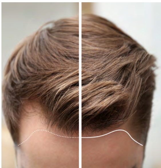
Den Geheimratsecken professionell die Stirn bieten.

Neu für unsere Region beinhaltet das Behandlungsspektrum auch die Haarverdichtung und Haartransplantation. Diese werden zusammen mit einem langjährig erfahrenen Team durchgeführt. Diese beginnt in der Enzian Clinic mit einer ehrlichen Beratung und endet mit einer intensiven Nachsorge. „Wer zu uns kommt, erhält eine umfassende Beratung. In einem ausführlichen